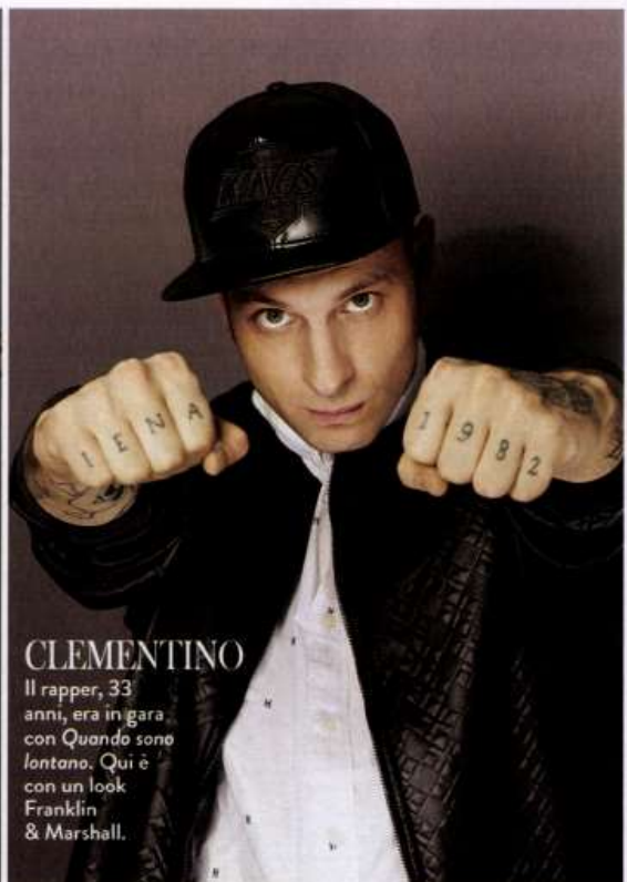
CLEMENTINO Il rapper, 33 anni, era in gara con Quando sono lontano . Qui è con un look Franklin & Marshall.