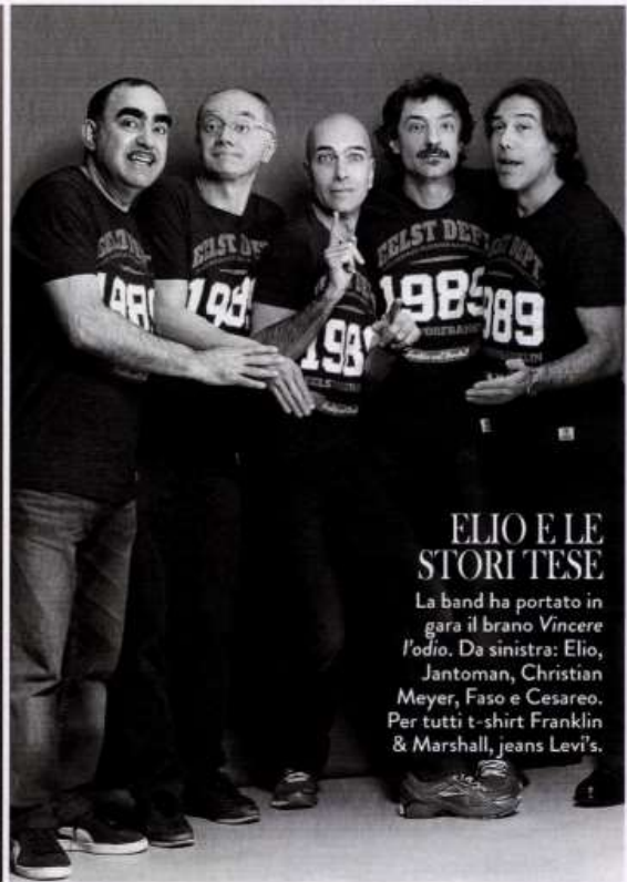
ELIO E LE STORIE TESE La band ha portato in gara il brano Vincere l'odio . Da sinistra: Elio, Jantomani, Christian Meyer, Faso e Cesareo. Per tutti t-shirt Franklin & Marshall, jeans Levi's.